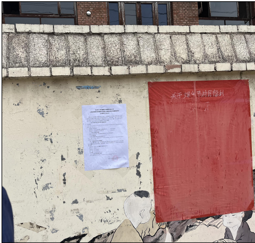
图 4 周边村庄公示