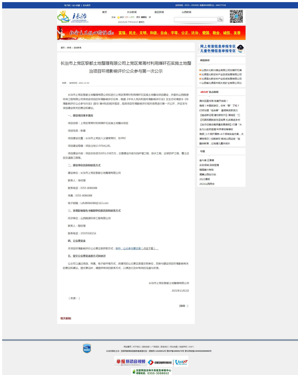
图 1 第一次网络公示截图

http://www.ichangzhi.com.cn/xinwen/gundongxinwen/72708.html 。第一次信息公开网络截图如下：