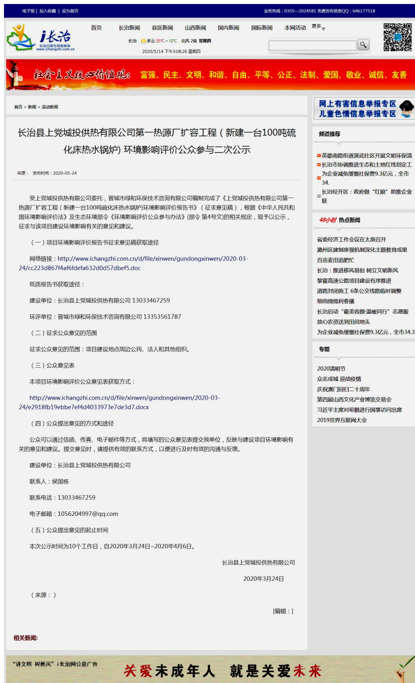
第二次网络公示截图

2020年3月24日，我公司通过“长治日报社网络媒体（ http://www.ichangzhi.com.cn/ ）”进行了环境影响评价信息第二次公示，公示时间为2020年3月24日~2020年4月6日，网络载体和公示时限符合《环境影响评价公众参与办法》中网络平台的要求。第二次信息公开网络截图及网络链接截图如下：