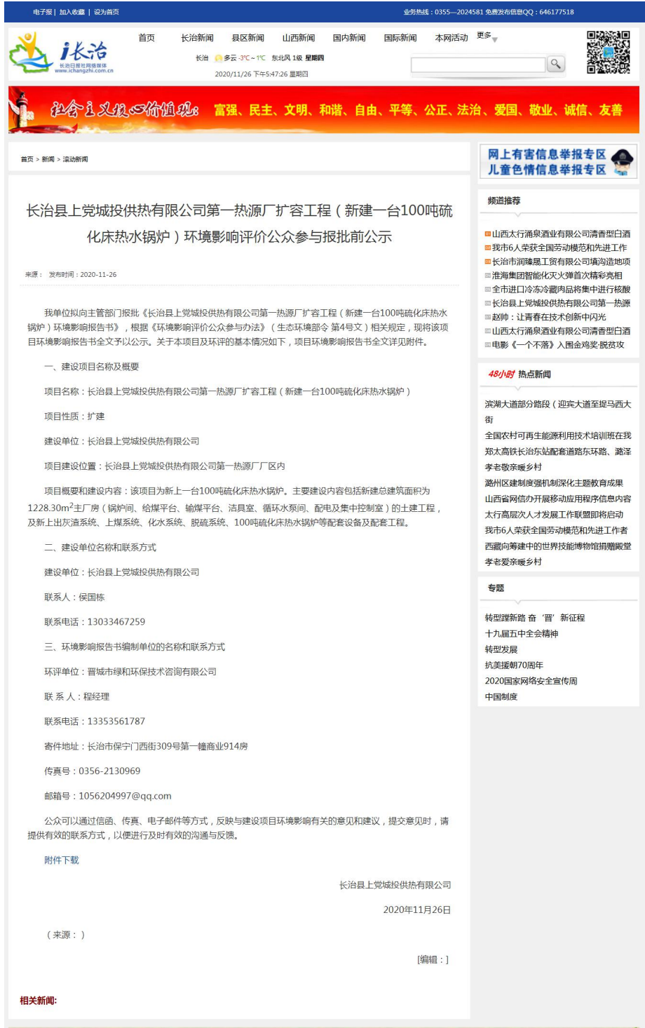
报批前网络公示截图

2020年11月26日，我公司通过“长治日报社网络媒体（ http://www.ichangzhi.com.cn/ ）”对拟报批的环境影响报告书全本进行了公示，网络截图如下：