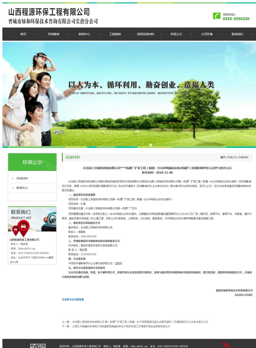
第一次信息公示截图

2019年11月8日，我公司通过“山西程源环保工程有限公司（晋城市绿和环保技术有限公司长治分公司）网站”进行了第一次环境影响评价信息公开，网络载体选择符合《环境影响评价公众参与办法》中网络平台的要求。第一次信息公开网络截图如下：